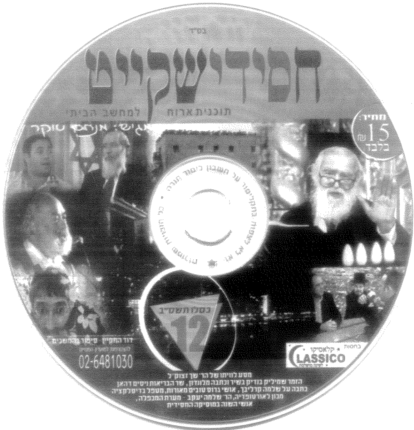
"חסידישקייט - תוכנית ארוכה למחשב הביתי" עשויה כשעטנז ז'אנרים טלוויזיונים פופולריים, ביניהם כתבות צבע ומגזין, בידור לצד תעודה כשברקע כל אלו מהדהדים מאפייניה של תוכנית האירוח החילונית. חיקוי הז'אנר המזוהה כל כך עם החברה החילונית של העידן הרב ערוצי בישראל מלמד, כך נדמה, כי במקרה זה הדיפוזיה התרבותית נישאה על כנפי המדיום